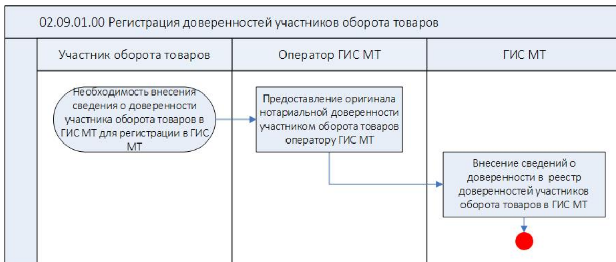
Рисунок 1 Схема процесса 02.09.01.00 Регистрация доверенностей участников оборота товаров

Схема процесса регистрации доверенностей участников оборота товаров в ГИС МТ представлены на [Рисунок 1 Схема процесса 02.09.01.00 Регистрация доверенностей участников оборота товаров].